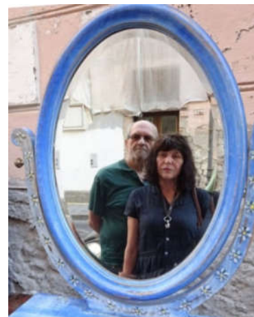
Gaeta 2019