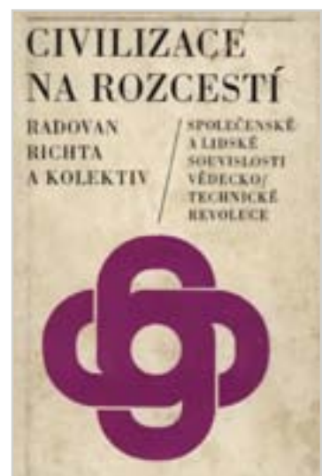
Třetí vydání populární knihy vědeckého týmu kolem Radovana Richty Civilizace na rozcestí vyšlo roku 1969 v nákladu 20 000 výtisků

To neplatí pro politiku. A až do roku 1989 se vládnoucí komunisté nikdy nebudou k roku 1968, na rozdíl od jiných států východního bloku, vracet