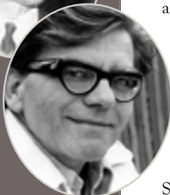
Radovan Richta a Karel Kosík (dole), vlivní myslitelé šedesátých let