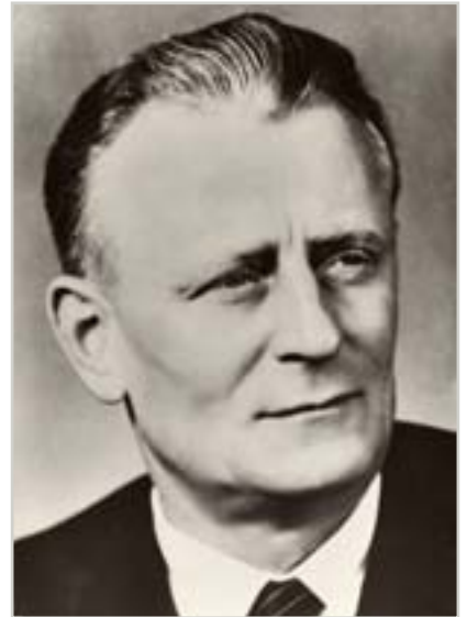
Antonín Novotný vykonával až do roku 1968 funkce prezidenta ČSSR i prvního tajemníka ÚV KSČ

Samozřejmě začala velkým zlomem, kdy po okupaci v srpnu 1968 měli mnozí strach z návratu stalinismu a některé konzervativní síly v KSČ po tom skutečně volaly. Zákazy tvrdě dopadly na filmovou či literární produkci. Pro